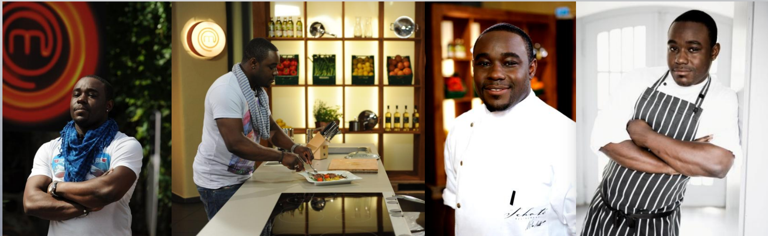
Star-und TV-Koch Nelson Müller